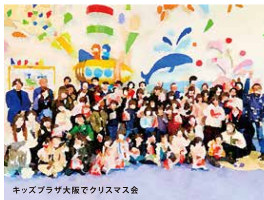
キッズプラザ大阪でクリスマス会

9月、大阪中之島美術館のアートラーニングプログラムに児童養護施設の子どもたちと参加しました。パリ・東京・大阪の3つの近代美術館の作品の中から、共通点のある作品を3点ずつ並べて展示する「TORIO展」を見て、自分なりの視点で意見を話すユニークなプログラムでした。語り合うことで見えないものが見えてきます。100年ほど前の美術作品を見るという貴重な機会を頂きました。