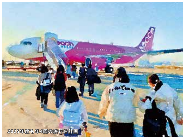
2025年度も年4回の旅行を計画

ぶつかり合う意見の対立をどう落とし所を見いだすか？自分の意見をいい、相手に信用される子どもを育てます。そして委託児童の員数を減らすと共に、過酷な労働環境を改善し、子どもにとってもおとなにとってもよりよい暮らしを創出することが2025年度の課題です。また事業を継承できる若いスタッフの育成を視野に、2025年度も引き続き夢みる未来をめざしてまいります。