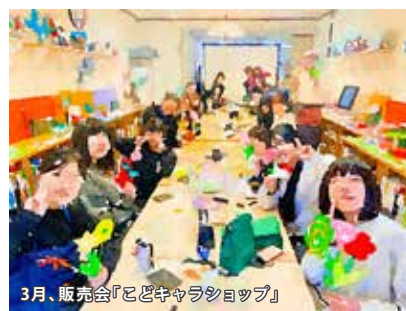
3月、販売会「こどキャラショップ」