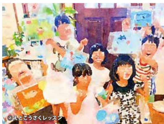
②えとこうさくレッスン