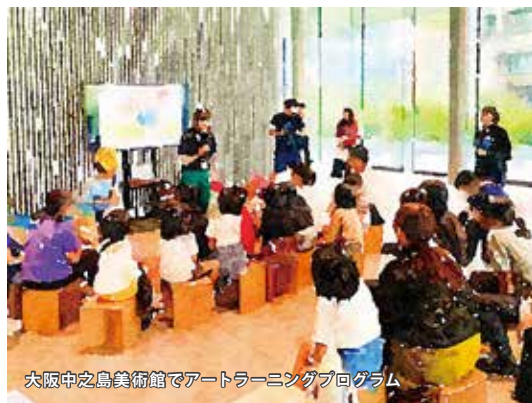
大阪中之島美術館でアートラーニングプログラム