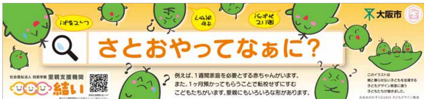
里親支援機関 結い様のJR車内広告