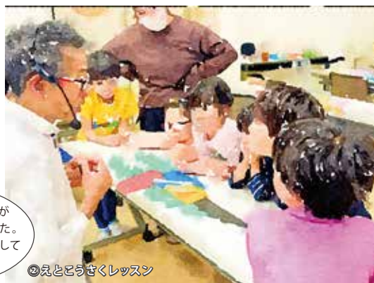
②えとこうさくレッスン