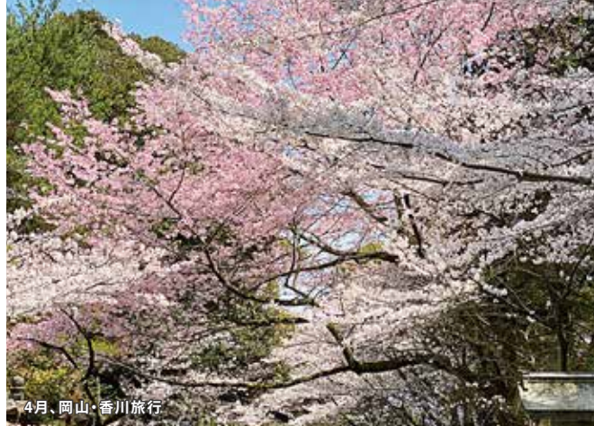
4月、岡山・香川旅行

2024年度は、子どもの人権を考えるあまり、おとなが子育ての責任を放棄しているのでは?と懸念する場面が多ありました。一方で、岡山・香川、和歌山、福井・金沢、北海道と旅行し、旅を通して子どもたちとの絆を深めました。しかし、そんな風に呑気にしていたら、ある子が突然、「お家に帰る」と言い出しました。しっかりとした意見表明です。ただ、所詮里親は、その子の人生の途中から途中までを養育する存在なのだとふと我に返り、あまりのめり込むことの危険性を感じた1年でもありました。