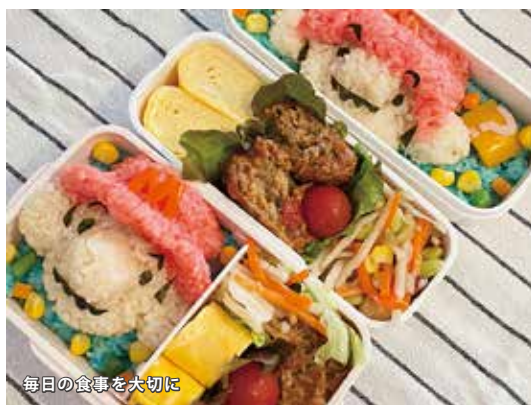
毎日の食事を大切に