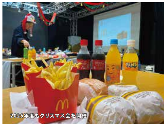
2025年度もクリスマス会を開催