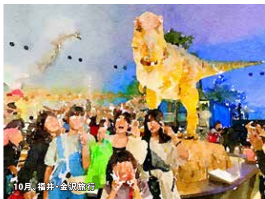
10月、福井・金沢旅行