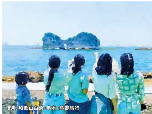
8月、和歌山白浜・串本・熊野旅行