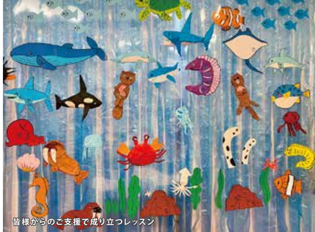
皆様からのご支援で成り立つレッスン

子どもデザイン教室の活動をご支援くださるキッズサポーター（賛助会員）の募集を推進します。毎月継続的にご寄付くださるご支援者を増やすことで、安定した運営基盤をめざします。