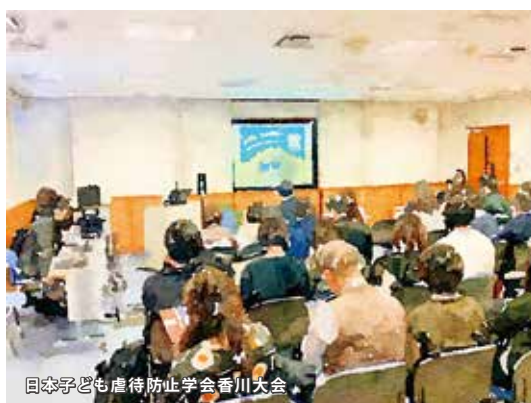
日本子ども虐待防止学会香川大会