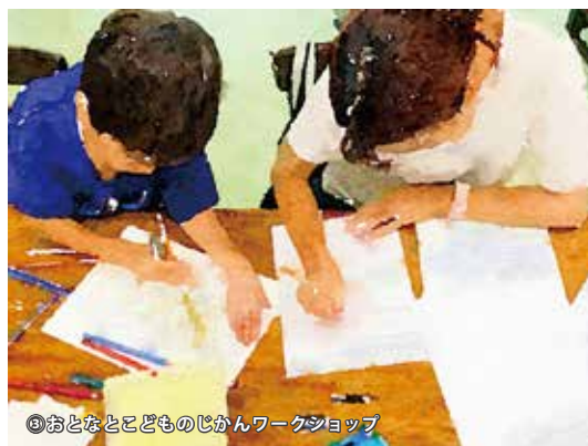
③おとなとこどものじかんワークショップ