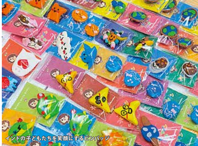
インドの子どもたちを笑顔にするピンバッジ

6月、大阪東ロータリークラブさんからのご依頼で、インドの子どもたちに笑顔のピンバッジを贈る「インドにスマイルプロジェクト」をしました。作ったピンバッジは全部で130個、全量を大阪東ロータリークラブ様にお買い上げ頂き、売上金52,000円は全て子どもたちの生活資金にしました。